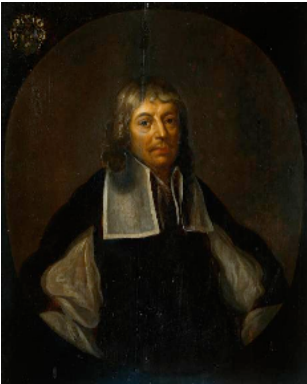
Gouverneur-generaal Joan Maetsuyker klaagde al in de zeventiende eeuw over de geringe taaltrouw van de Nederlanders.

Een derde argument dat het Nederlands als omgangstaal in Indië geen ingang heeft gevonden is dat Indië een aanzienlijke islamitische bevolking kende en het Nederlandse koloniale bestuur er van af zag de islamieten te kerstenen. Het bekeren van de inlanders in niet-islamitische gebieden tot het christelijke geloof gebeurde, aanvankelijk, in het Nederlands, met als argument dat de inlandse talen onvoldoende toegerust zouden zijn om zo iets ingewikkelds als het geloofskwesties te kunnen uitleggen. Overigens is het de vraag of missionarissen en zendelingen toch niet vaak voor de inheemse taal kozen, want bij hen staat bekering voorop. Ook de Spanjaarden hadden al in 1550 gesteld dat de nieuwe koloniën gekerstend en daarom verspaanst moesten worden, maar de uitvoering van die oekaze van Karel de Vijfde werd overgelaten aan de missionarissen en die zagen toch meer heil in zieltjes winnen dan in verspaansing. In het artikel 'Westerse koloniale taalpolitiek' geeft Groeneboer nóg een (deel)verklaring voor het allesbehalve dwingende taalbeleid van de zeventiende-eeuwse Nederlandse republiek: de Nederlanders zouden taalimperialisme 'een verdacht instrument met nationalistische trekken' hebben gevonden. Daarnaast wordt ook wel als argument aangevoerd dat de VOC een op winst gerichte onderneming was die op de eerste plaats winst wilde maken en zich niet bezighield met de verbreiding van geloof of cultuur.