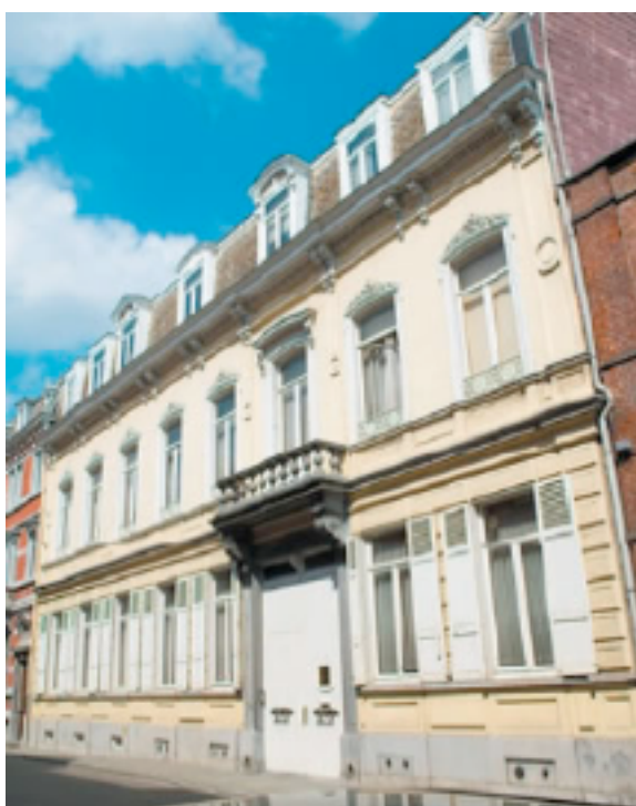
Vlaams parlement in Brussel